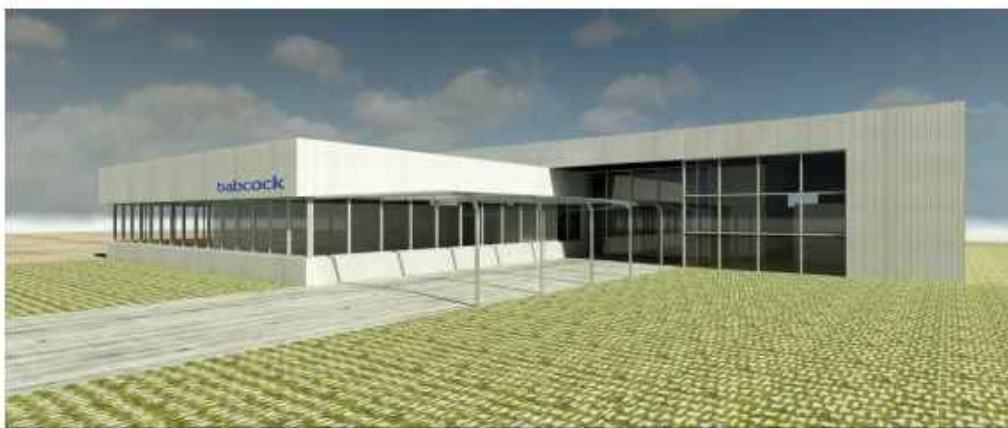
VISTA ACCESO PRINCIPAL

Actualmente se encuentran en construcción los dos primeros hangares, que se ubicarán en los terrenos de la Fase 1. Estos hangares están siendo construidos por dos empresas multinacionales, INDRA y BABCOCK, que se encuentran ejecutando sendos programas conjuntos de I+D con GAIN en el marco de la Civil UAVs Initiative.